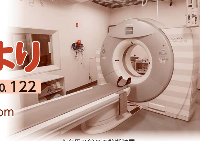
全身用X線CT診断装置