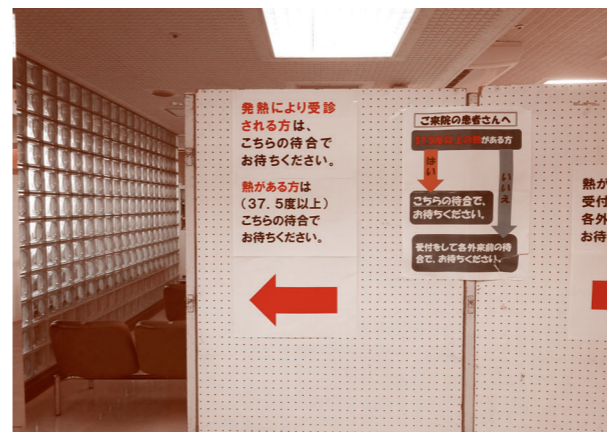
感染防止対策として発熱外来を設置

今後もスタッフの力を借りながら、芽室町民の皆さまの期待に応えられるような病院となるよう、職員一同努力してまいりますので、どうぞよろしくお願い申し上げます。