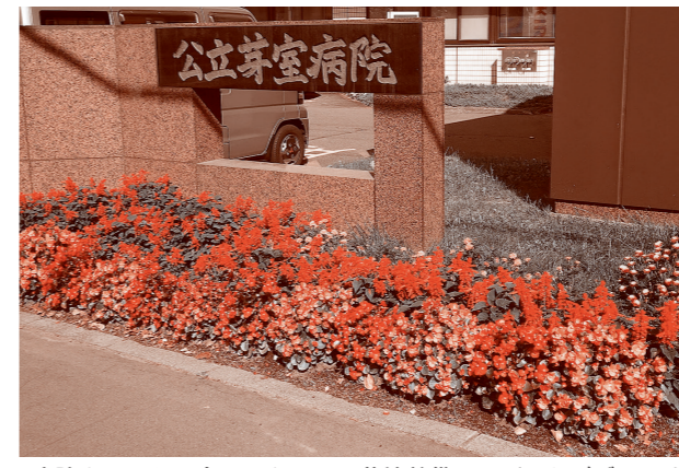
病院をささえる会のみなさん 花壇整備ありがとうございます