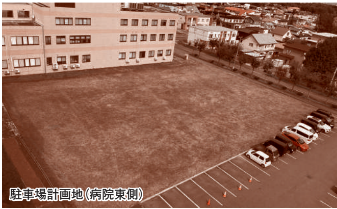
駐車場計画地(病院東側)